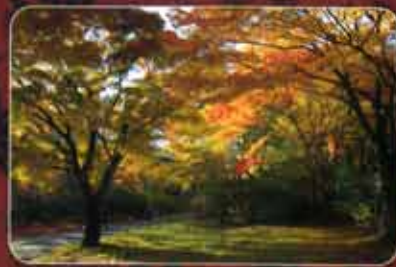
伊香保温天風呂、県立伊香保森林公園周辺なども紅葉の名所です。

その湯元「河鹿橋」付近には榛名山系の豊かな自然に育まれた、もみじ、かえで、くめぎ、うるしなどが自生しています。これらの樹々の紅葉は、毎年10月下旬から一斉に色づき始め、11月上旬にはピークを迎えます。ライトアップに浮かび上がる、幽玄な夜の紅葉をお楽しみください。