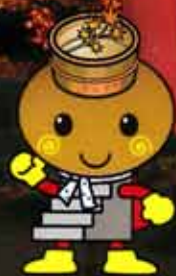
伊香保温泉キャラクター「いしだんくん」

実施期間 10月22日(火)～11月17日(日) 予定 点灯時間 16:30～22:30 予定